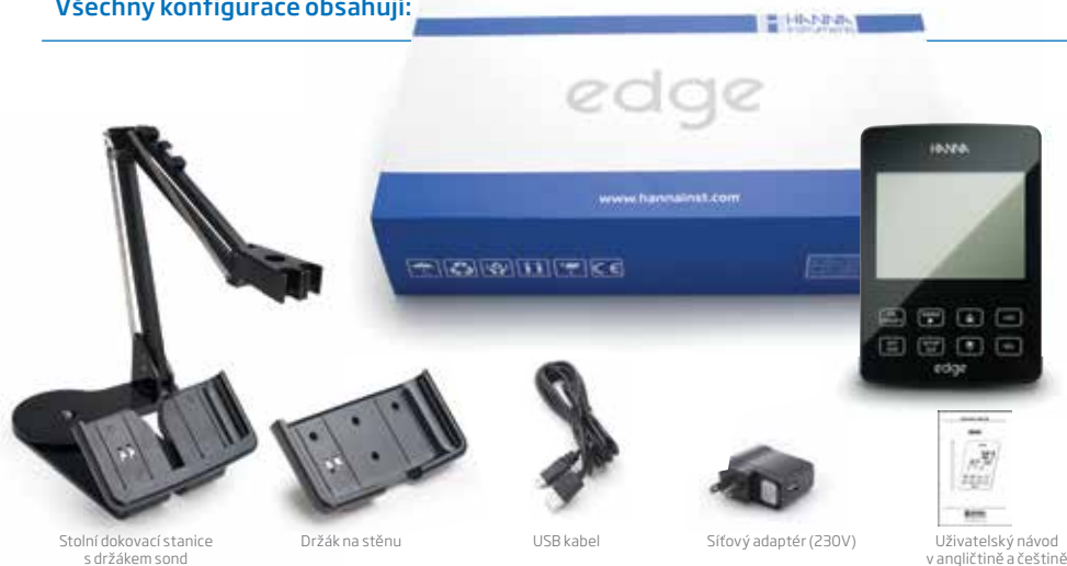
Stolní dokovací stanice s držákem sond