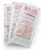
3 sáčky standardu 1413 µS/cm