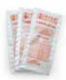
3 sáčky standardu 12880 µS/cm